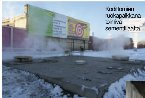
Kodittomien ruokapaikkana toimiva sementtilaatta.

päälle. Laatan alta tuli lämmintä höyryä, joka vähän lievensi pakkasen vaikutusta.