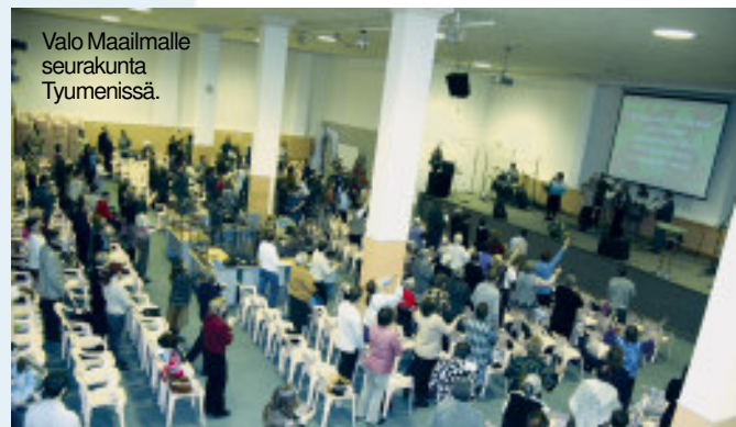
Valo Maailmalle seurakunta Tyumenissä.

Lisää informaatioita venäjänkielillä löytyy Tyumenin seurakunnan kotisivuilta www.light-world.ru