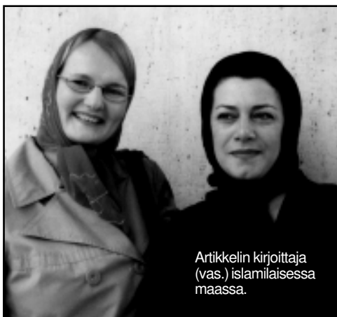
Artikkelin kirjoittaja (vas.) islamilaisessa maassa.